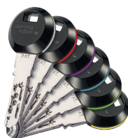
Nos clips transponder RFID os elementos circulares em 6 cores facilitam a orientação